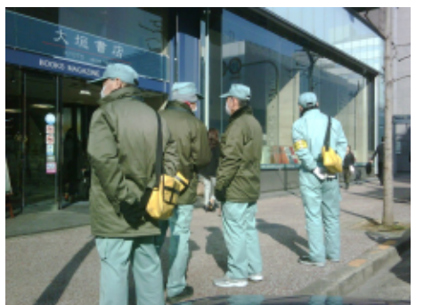
放置自転車の啓発員

そして、このような看板と同時に縦割り行政を打破すべきなのは、路上の啓発員だ。京都市には多数の啓発員がいる。放置自動車(行財政局)、屋外広告物(都市計画局)、道路占有(建設局)、路上喫煙(文化市民局)、放置自転車(建設局)に対する啓発など多数の職員を抱える。もちろん全てに多額の人員費が発生。例えば、道路占有だけでも、人員費(係長1名、職員3名、嘱託6名)はざっと3,000万円以上。この役所内の2重行政とも言える、縦割り行政を打破すべきだ。この実務レベルでの業務整理は、25年度の京都党市会議員団の市長への予算要望でも訴えた。しかし、その回答は前向きとは言えない。例外を排除した徹底的な業務体制の見直しを実施し、効率的でスリムな組織体制を構築すべきだ。