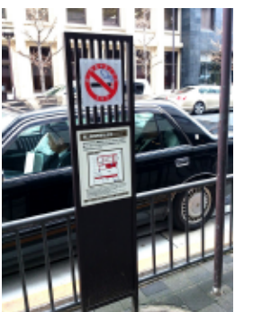
路上喫煙の啓発看板

京都市は路上喫煙の取り締まりを平成19年から実施。市内中心部での禁止からはじまり、禁止エリアは平成22年にさらに拡大。京都駅エリアと清水・祇園エリアも禁止区域となった。しかし、まだまだその認識が低い。だからこそ、啓発が必要だ。そもそも、この禁止エリアの指定にも疑問がある。なぜ、市内全域ではないのか。今後、禁止エリアは拡大するであろう。そのために、必要となるのが路上喫煙禁止の警告看板だ。この路上喫煙の警告に放置自転車の警告看板を転用してはどうか。事実、現在の路上喫煙の警告看板は、新しい放置自転車の警告看板のデザインを参考に作成。なので、転用は可能だ。縦割り行政を打破した取り組みこそ、必要だ。