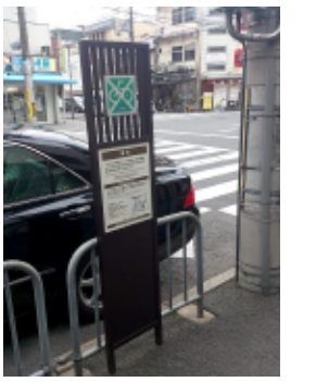
新しい放置自転車の啓発看板

このように、放置自転車の数は減少をしているものの、放置自転車の警告看板は減少をしていない。市内には警告看板が1,344台もある。この警告看板は、平成22年に「京都市未来まちづくり100人委員会」からデザインの変更に対する提言があった。古い警告看板がまちの景観を乱しているためだ。新しい警告看板は、京町家の虫籠窓(むしこまど)をイメージしたデザインとなり、評価も高い。しかしながら、一部でこの警告看板の取り替えが終わっていない。市内を自転車で行きながら、学生スタッフと一緒に、現地調査をした。