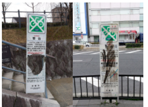
古い放置自転車の啓発看板

なんと調査した結果、警告看板の22%(新看板219枚、旧看板63枚)も古いままだったのだ。そのカラクリはこうだ。古い看板が放置されたままだったのは「国道」と「鴨川」。つまり、国の管理する「国道」と府の管理する「鴨川」の警告看板が放置されたままだったのだ。市民の放置自転車はせつせと撤去をしながら、国と府が管理をする警告看板はほったらかし。これこそ、まさに3重行政の失敗例だ。しかも、放置をされた看板は言葉も出ないほどの有様であり、京都の景観を破壊している。国と府と連携をして、問題のある看板をすぐに撤去するように要請した。