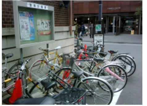
放置自転車の様子

京都市の自転車政策を学ぶために、全国各地の議会から視察に訪れるなど、本市の自転車政策は日本のトップランナーである。御池にまちなか駐輪場ができるなど、駐輪場対策も厳しい財政状況の中に、前進をしている。とはいえ、自転車政策に対する市民の不満はまだ高い。特に市内中心部にまだまだ不足をする駐輪場の整備、放置自転車、自転車の走行環境などに不満の声がある。一方で、市内の放置自転車の台数は着実に減少。4,300台(平成18年)あった放置自転車は、2,034台(平成23年)へと半数以下までに減少をしたのだ。