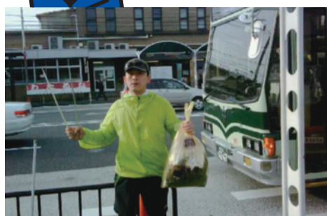
(1)九条車庫の前を清掃。

民間では自らの事業所の前ぐらい掃除するのは当たり前だ。「掃除をする姿勢」を市民に見せることこそが、交通局の信頼の向上につながるのだと交通局に訴えた。交通局は要望を受け入れ、職員が九条車庫の周辺を清掃すると約束!!