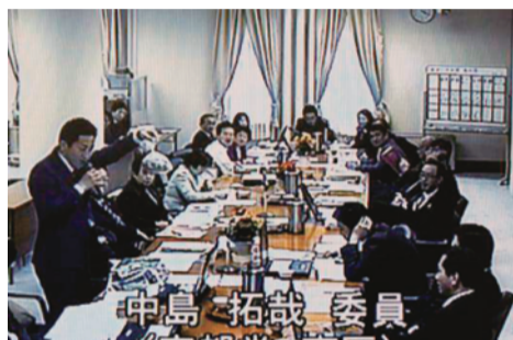
(2)拾い集めたゴミを委員会室に持ち込む。