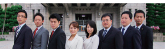
地域政党「京都党」幹事団