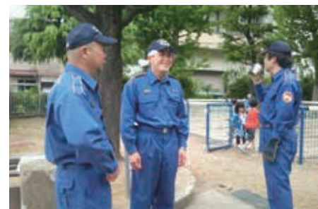
▲唐橋消防団の一員です。