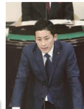
▲代表質問をしました。