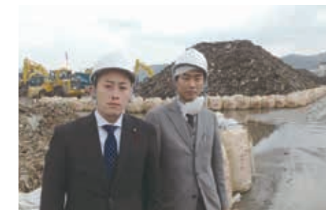
▲岩手県の震災ガレキを視察。