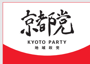
地域政党「京都党」市会議員団

平成22年8月、堀場製作所創業者、京都市元副市長、大学教授、前市会議員などと結党。現在、市議4名。市民主導の政治を目指し、しがらみ政治を一掃中。