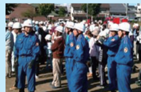
唐橋消防団の一員として学区防災会に参加(前列一番右)

東日本大震災を経て、災害発生時の消防団の力が再び注目されている。一方で、消防団の詰所である器具庫の耐震化が遅れている。市内33カ所(唐橋消防団含む)の耐震化がまだ未達成。市では耐震化を促進させるため、耐震補強の助成制度を設けているものの、地元の財政事情から器具庫の耐震化が進まない。器具庫には災害に備え、様々な装備を配置。この装備を守る器具庫が地震で倒壊しては意味がない。