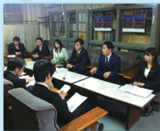
「京都党」、「みんなの党 無所属の会」の合同記者会見

11月議会の直前に突如降って湧いた問題がある。現業職の採用再開。現業職とは、ごみの収集員や土木作業員などのこと。この現業職は平成18年に、採用が全面凍結した経緯がある。当時、現業職員による不祥事が大きな社会問題となった。覚せい剤の売買や盗強など市の職員とは信じられないような事件が数多く発生。結果、当時の樹本市長と議会は、市民の信頼を回復するために、連日連夜議論を交わし、「信頼回復と再生のための抜本改革大綱」を策定。この大綱で、現業職の職員採用凍結が示されていた。